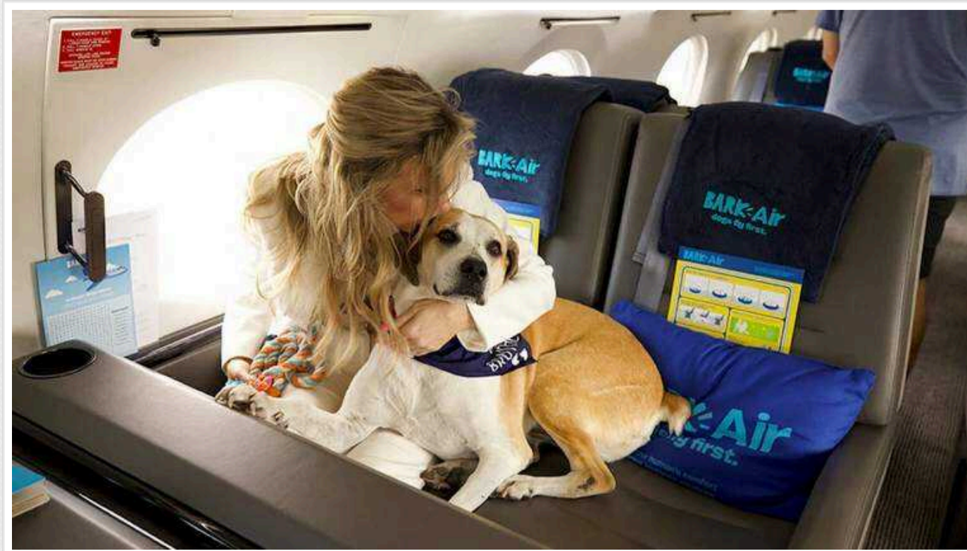
У США запрацювала перша авіакомпанія для собак

У США відбувся перший рейс авіакомпанії для собак BARK Air. На літак із Нью-Йорка до Лос-Анджелеса продали всі 10 квитків.