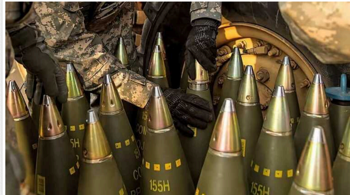
РФ виробляє артилерійські снаряди приблизно втричі швидше, ніж західні союзники, – ЗМІ

Країна-агресорка Росія виробляє артилерійські снаряди приблизно втричі швидше, ніж західні союзники України, і ці боєприпаси коштують приблизно вчетверо дешевше.