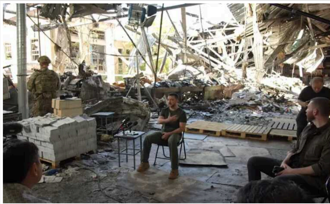
У нас ненависть і злість до всього російського, - Зеленський

Через жорстокі удари, яких завдає Росія та які супроводжуються численними жертвами серед українців, у більшості представників нашого народу з'явилися злість та ненависть до всього російського. Злочини та агресія РФ призвели до того, що навіть розмовляти російською багатьом українцям стало важко.