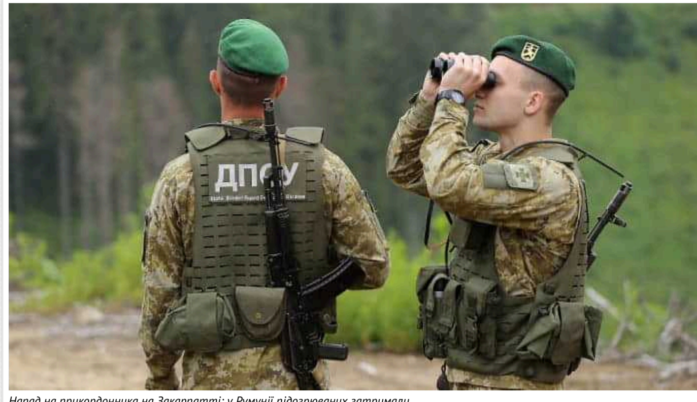
Напад на прикордонника на Закарпатті: у Румунії підозрюваних затримали

У Румунії прикордонники затримали двох чоловіків, які підозрюються у нападі на українських прикордонників на Закарпатті під час нелегального перетину кордону.