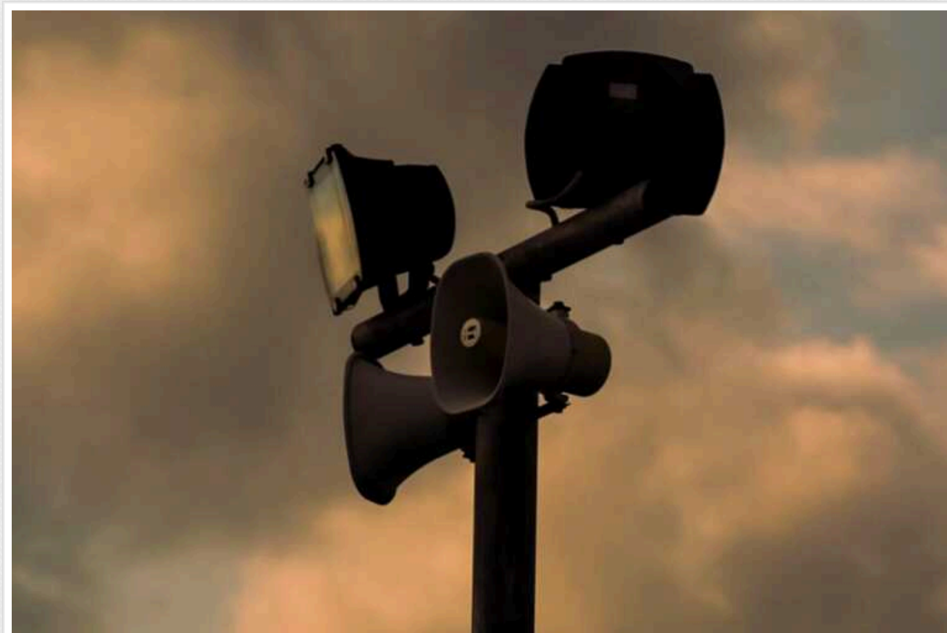
Новий антирекорд повітряної тривоги: в Харківській області тривала близько 20,5 години

Новий антирекорд повітряної тривоги в Харківській області.