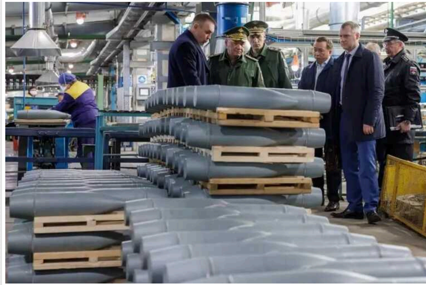
РФ виробляє снаряди втричі швидше і на 75% дешевше, - Sky News

Sky News повідомляє, що Росія виробляє артилерійські снаряди приблизно втричі швидше за західних союзників України і на 75% дешевше.