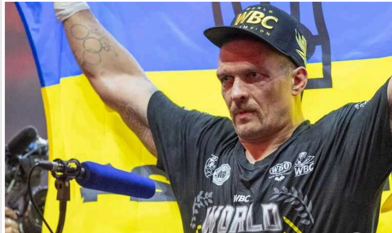
Колишній чемпіон світу Карл Фроч зажадав від Усика завершити кар'єру

Колишній чемпіон світу у другій середній вазі Карл Фроч наполягає, що абсолютний чемпіон світу в суперважкому дивізіоні Олександр Усик досяг всього у кар'єрі і йому більше нічого доводити. Фроч у підкасті The Verdict з Джорджем Гроувсом на talkSPORT заявив, що українцю час вішати рукавички на цях.