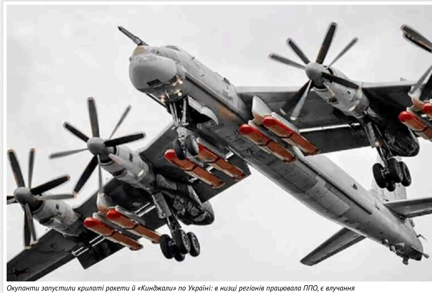
Окупанти запустили крилаті ракети й «Кинджали» по Україні: в низці регіонів працювала ППО, є влучання

У ніч на неділю, 26 травня, країна-агресор Росія підняла у повітря групу літаків Ту-95МС і МіГ-31К, які під ранок здійснили пуски крилатих ракет і "Кинджалів" по Україні. Перед тим ворог атакував наші регіони дронами-камікадзе типу Shahed. Внаслідок дій агресора є влучання і постраждали.