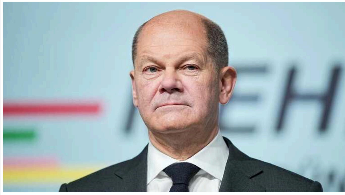
Шольц повідомив, що Німеччина дійшла до межі можливостей допомоги Україні

Канцлер Німеччини Олаф Шольц заявив про "межу можливої" у допомозі Україні.