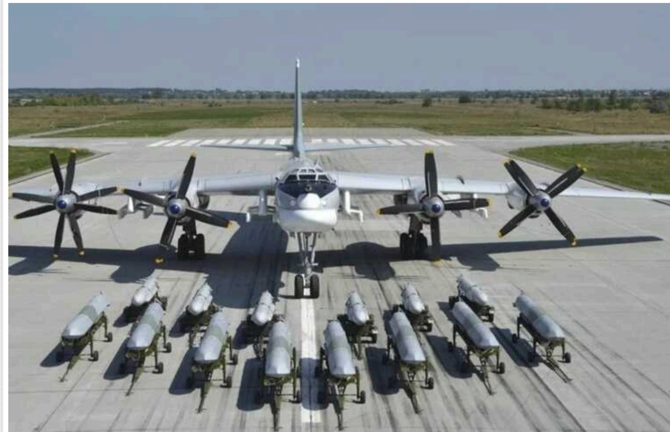
У РФ злетіли стратегічні бомбардувальники Ту-95: над ранок можливий обстріл