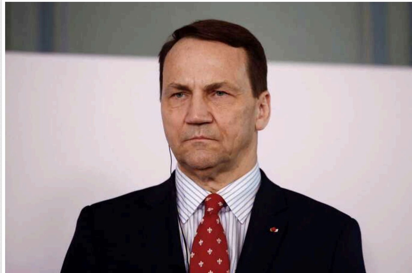
Радослав Сікорський закликав країни ЄС не платити соцвиплати українцям призовного віку

Польський міністр закордонних справ Радослав Сікорський висловив думку, що українці призовного віку, які перебувають у Польщі, не повинні отримувати соціальні виплати, якщо вони ухиляються від військової служби.