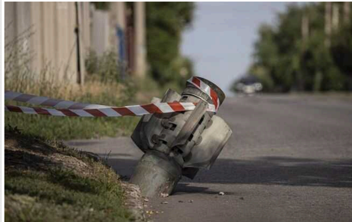
Через ворожі обстріли на Херсонщині четверо осіб зазнали поранень

У суботу, 25 травня, російські загарбники продовжували обстрілювати Херсонську область. Відомо про чотирьох поранених.