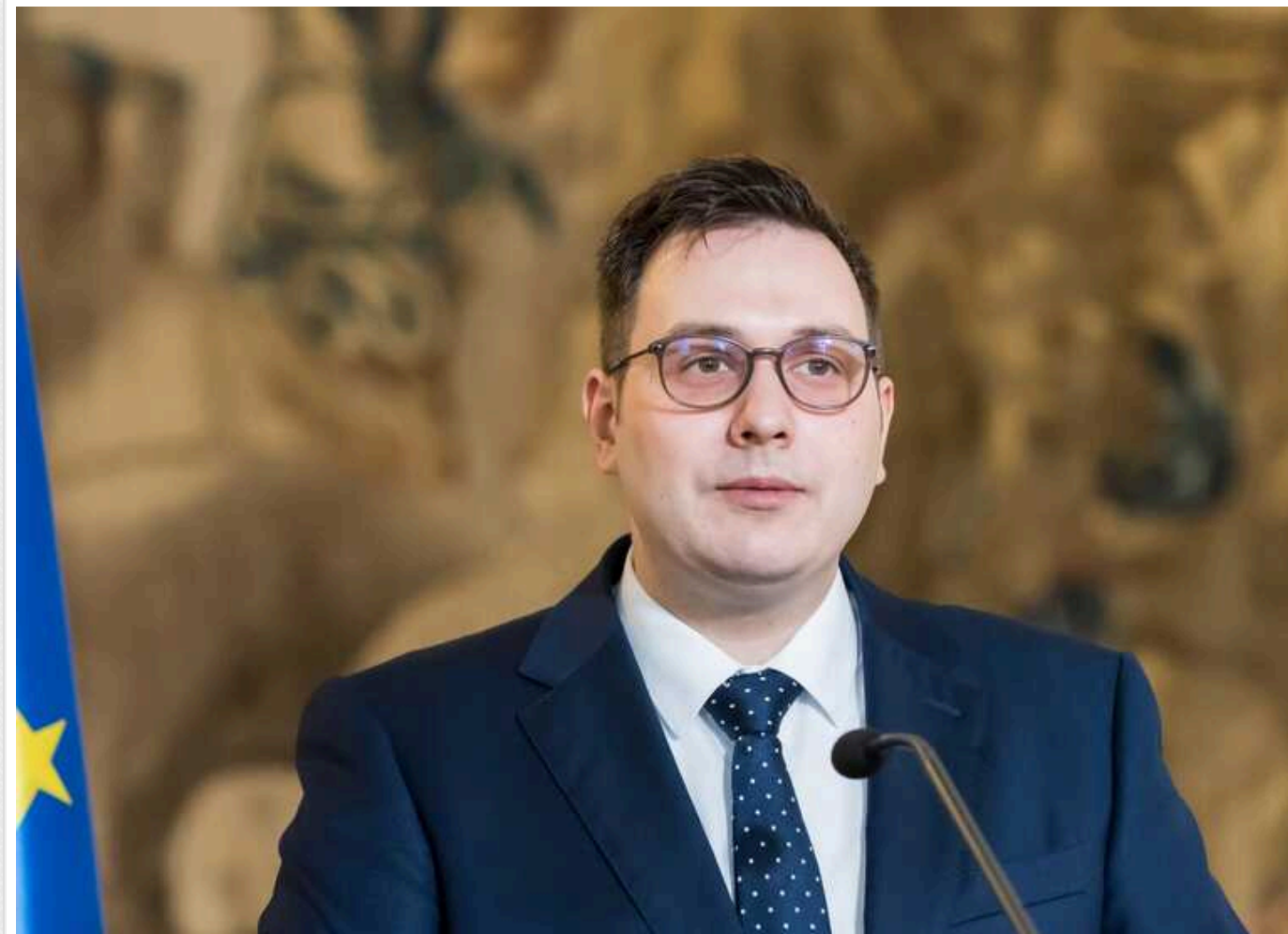
Глава МЗС Чехії Ян Ліпавський закликав партнерів по НАТО посилити підтримку України

Ще вчора російський диктатор Володимир Путін сигналізував світу про бажання "заморозити війну", а сьогодні його військові злочинці ударили по гіпермаркету "Епіцентр" в Харкові. Саме тому вірити "сигналам" з російської сторони не можна.