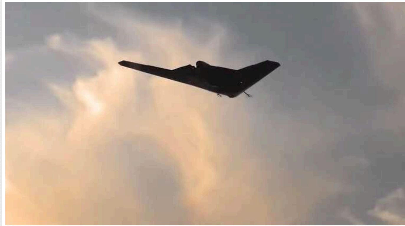
В Україні повітряна тривога: ворог запустив "Шахеда" з південно-східного напрямку

Увечері в суботу, 25 травня, областями України почала ширитися повітряна тривога. Російські окупанти вкотре запустили дрони-камікадзе типу Shahed.