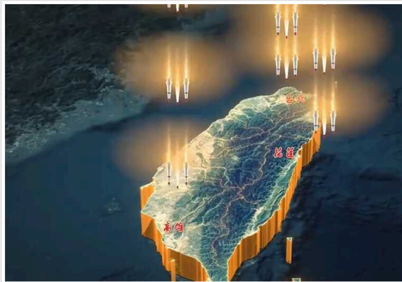
Китай показав імітацію ракетних ударів по Тайваню

24 травня китайська армія показала імітаційні ракетні удари із застосуванням авіації проти Тайваню під час тренувань.