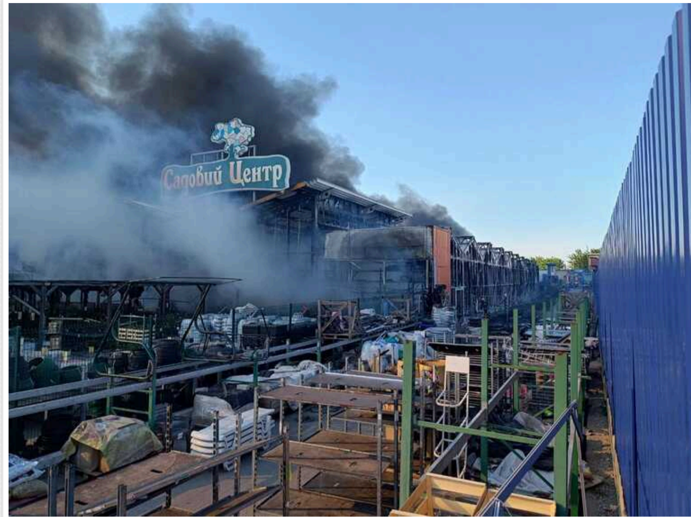
Зеленський відреагував на російський удар по Харкову: Путін божевільний, а Україні потрібно більше ППО

Російський удар по Харкову 25 травня – черговий прояв божевілья Росії та, зокрема, її диктатора Володимира Путіна. Україна потребує більше систем ППО, щоб не допустити подібних терористичних ударів.