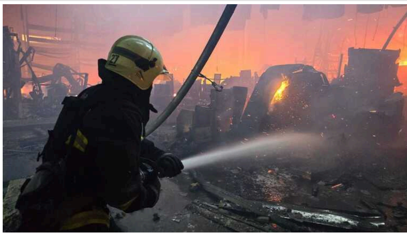
Удар по будівельному гіпермаркету в Харкові: кількість поранених збільшилася до 24

Кількість поранених унаслідок ударів по будівельному гіпермаркету в Харкові збільшилася до 24, повідомив керівник ОВА Синьгубов.