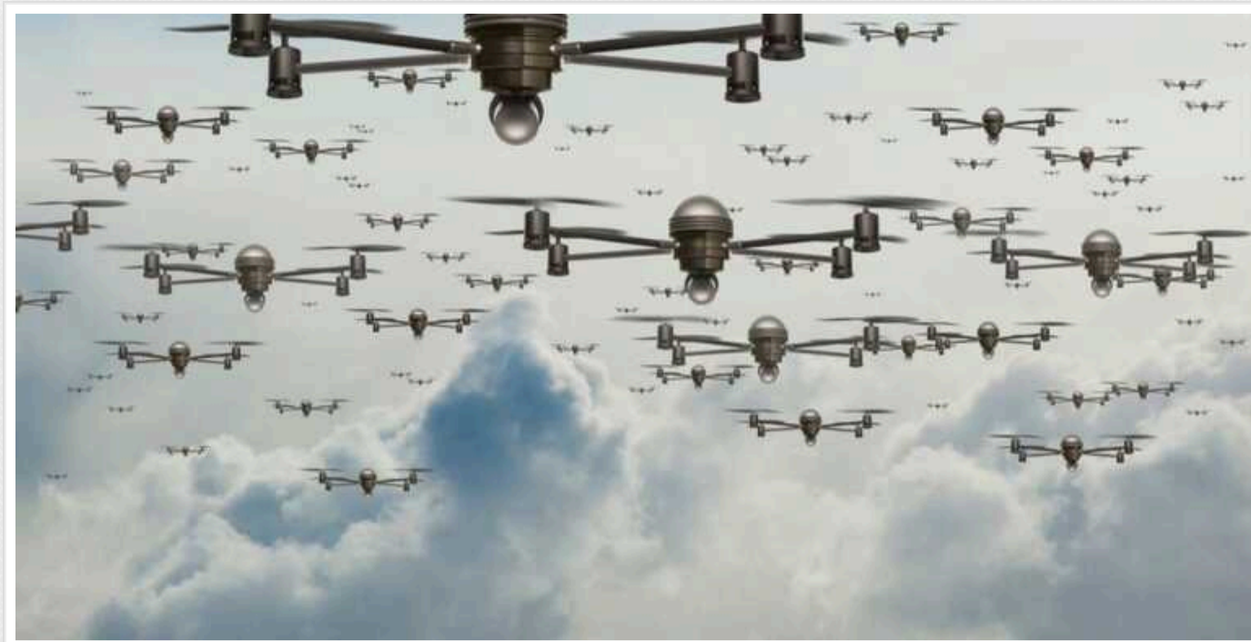
Польща, Фінляндія, Норвегія та країни Балтії домовилися про «стіну дронів» для захисту кордонів

Країни Балтійського регіону домовилися про створення "стіни дронів" для захисту своїх зовнішніх кордонів за допомогою безпілотних літальних апаратів.