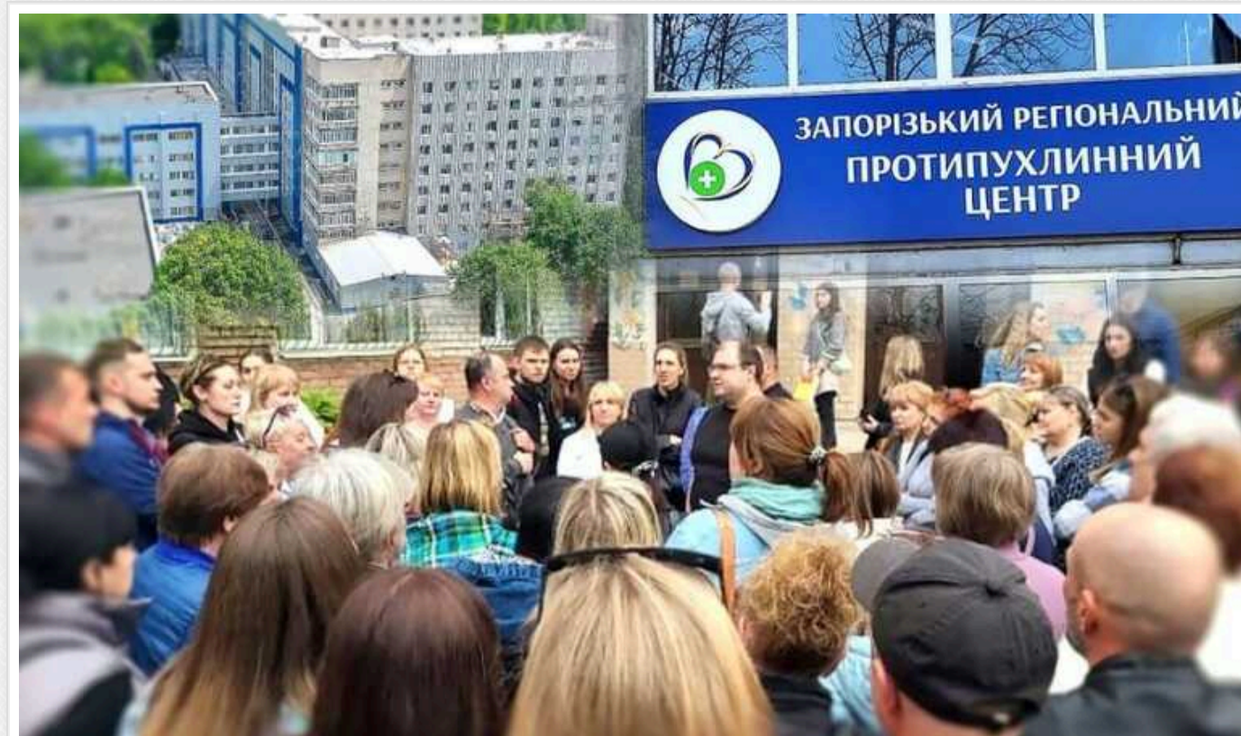
У Запоріжжі лікарям, які судяться проти закриття місцевого онкоцентру, видають повістки