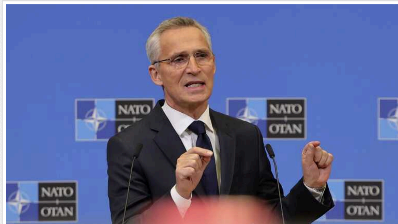
Настав час дозволити Україні бити по території Росії західною зброєю, – Столтенберг

Генсек НАТО Єнс Столтенберг вважає, що для окремих союзників настав час переглянути обмеження щодо використання наданої Україні зброї проти цілей на території РФ.