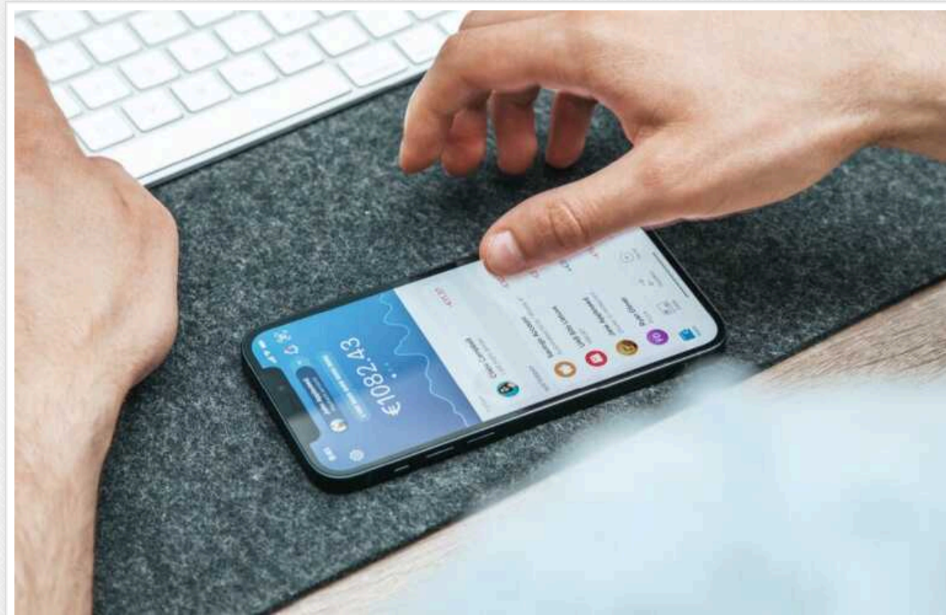
НБУ хоче обмежити карткові перекази: навіщо це потрібно, які ліміти діють у Приваті та monobank зараз

Нацбанк уже до кінця червня 2024 року може затвердити нове обмеження на Р2Р-перекази українців (між рахунками фізособам) – 100 тисяч гривень на місяць та 30 вихідних транзакцій для одного рахунку.