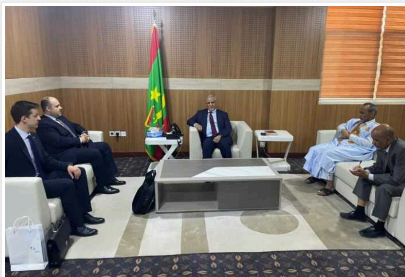
У Мавританії відкрили українське посольство

Посольство України офіційно розпочало роботу в Ісламській Республіці Мавританія.