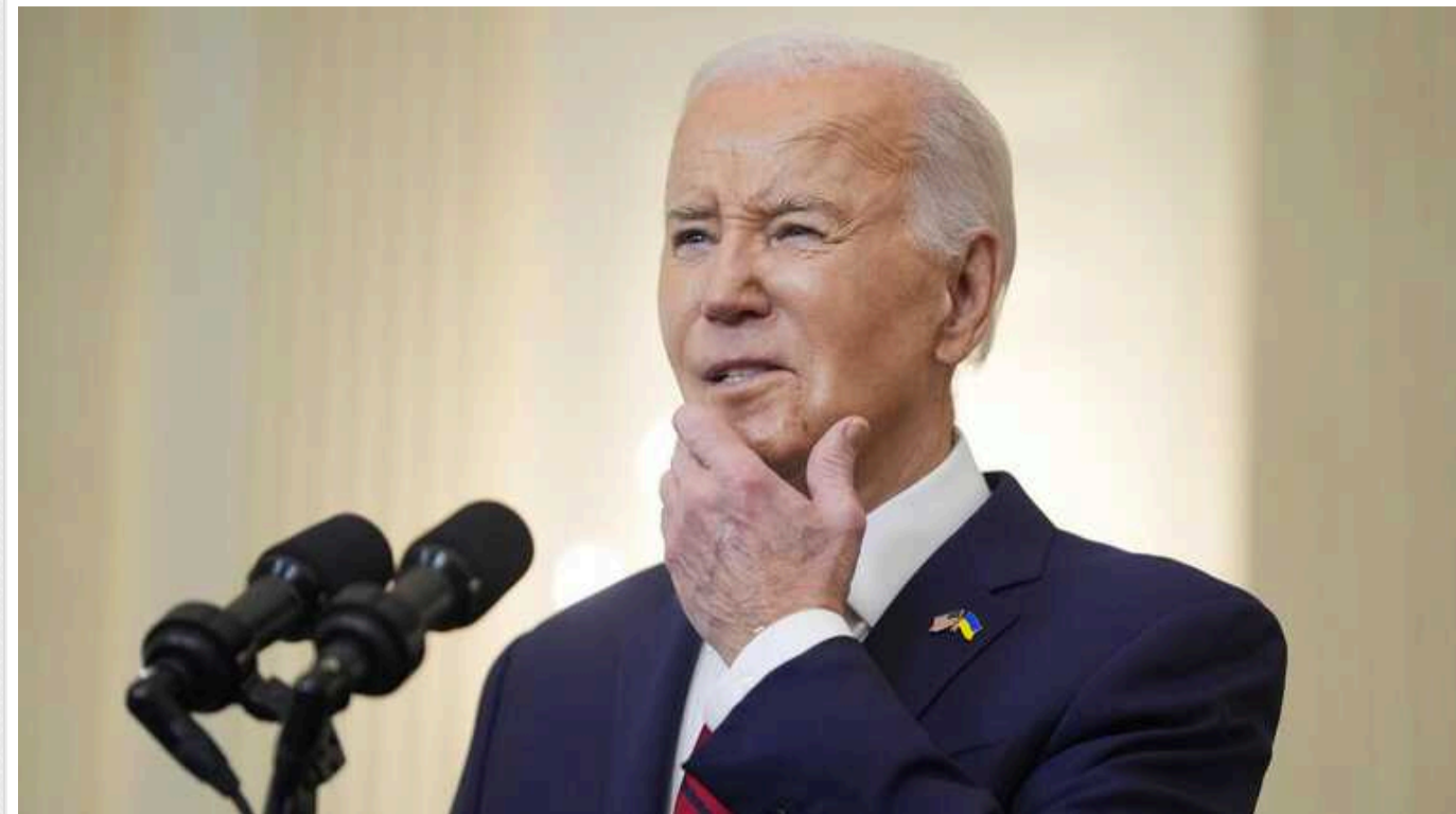
Bloomberg: Байден, ймовірно, пропустить Глобальний саміт миру у Швейцарії

Президенту США Джо Байдену, ймовірно, доведеться пропустити Глобальний саміт миру з врегулювання війни в Україні, оскільки він має бути присутнім на благодійному заході зі збору коштів на передвиборчу кампанію в Каліфорнії.