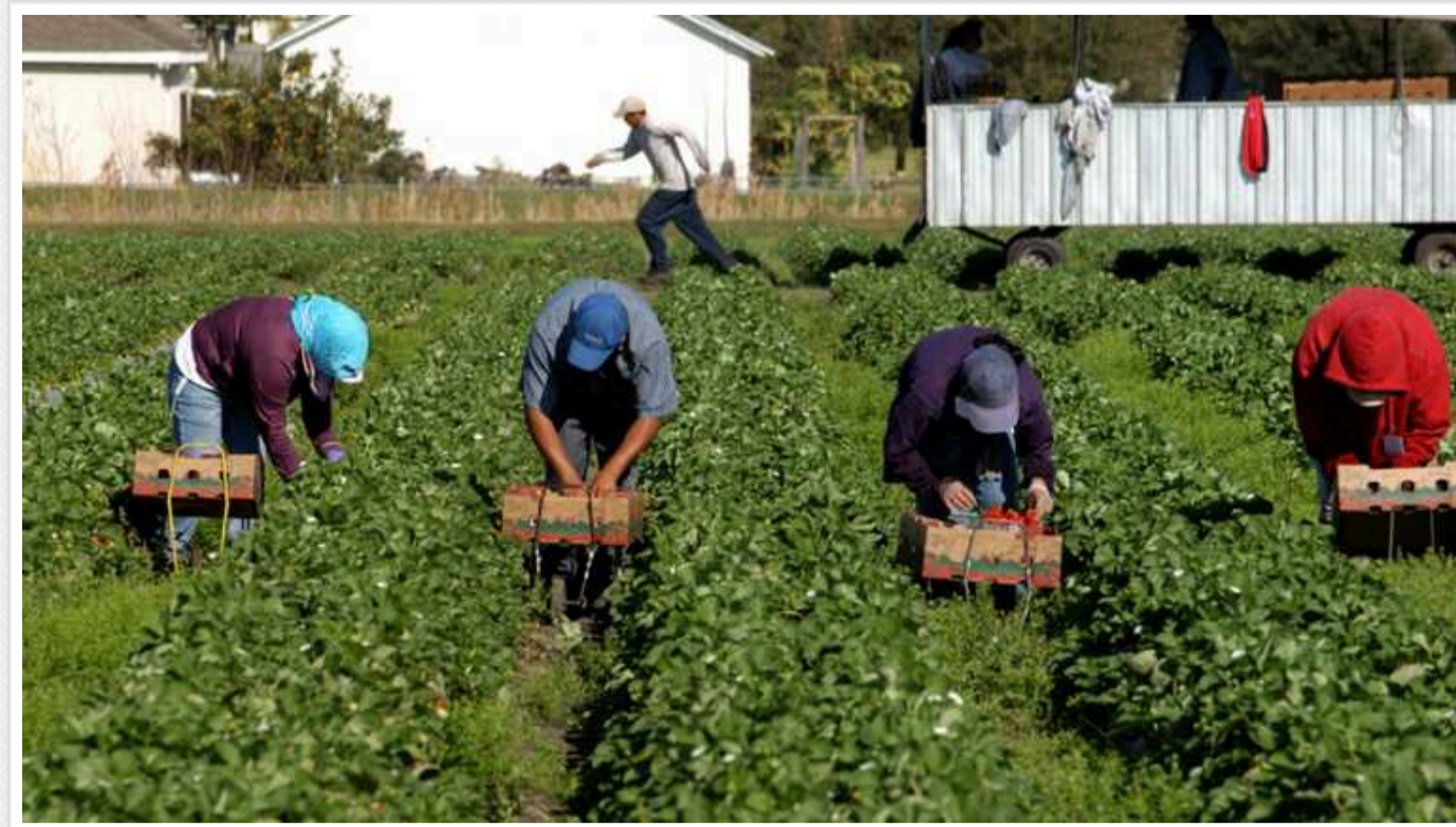
У Польщі почали скаржитися на нестачу українців

У Польщі не вистачає українських працівників. Замість сезонної роботи українські біженці йдуть в інші країни ЄС. В результаті немає охочих виконувати сезонні роботи.