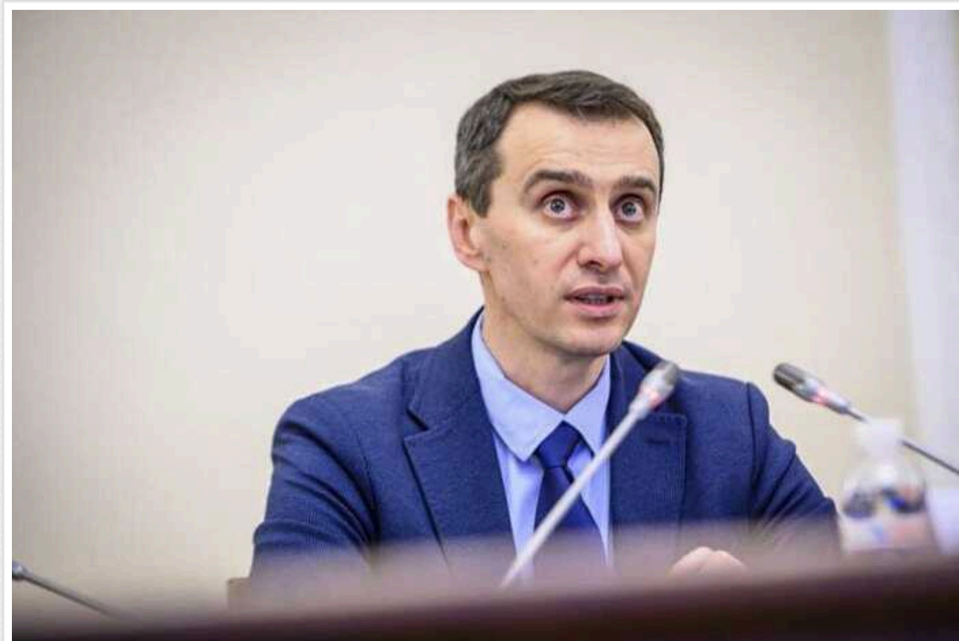
В Україні зареєстровані 23 000 пацієнтів з ПТСР, – Ляшко