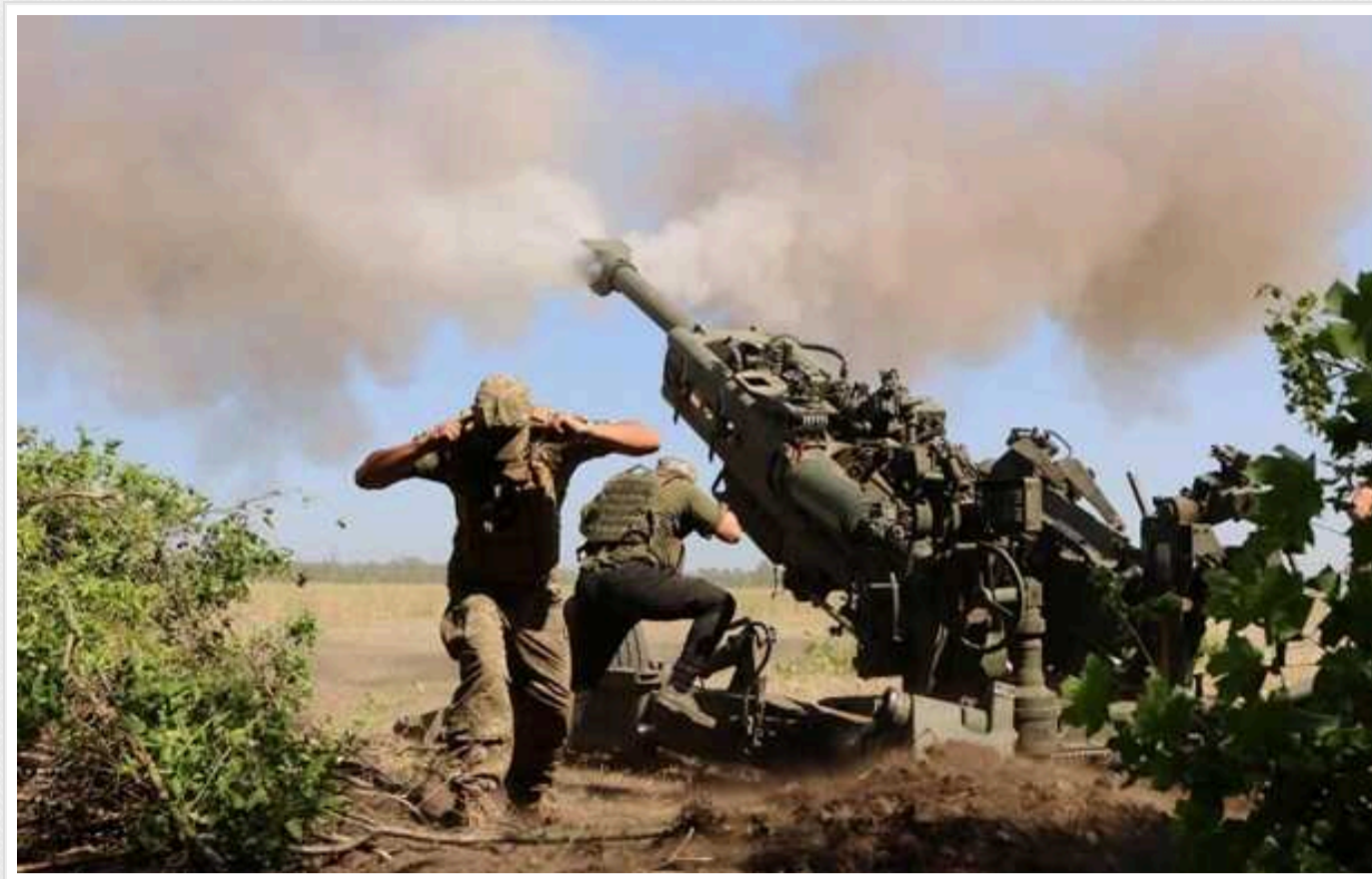
Ситуація на фронті: Протягом минулої доби відбулося 139 бойових зіткнень

На фронті впродовж минулої доби сталося 139 бойових зіткнень.