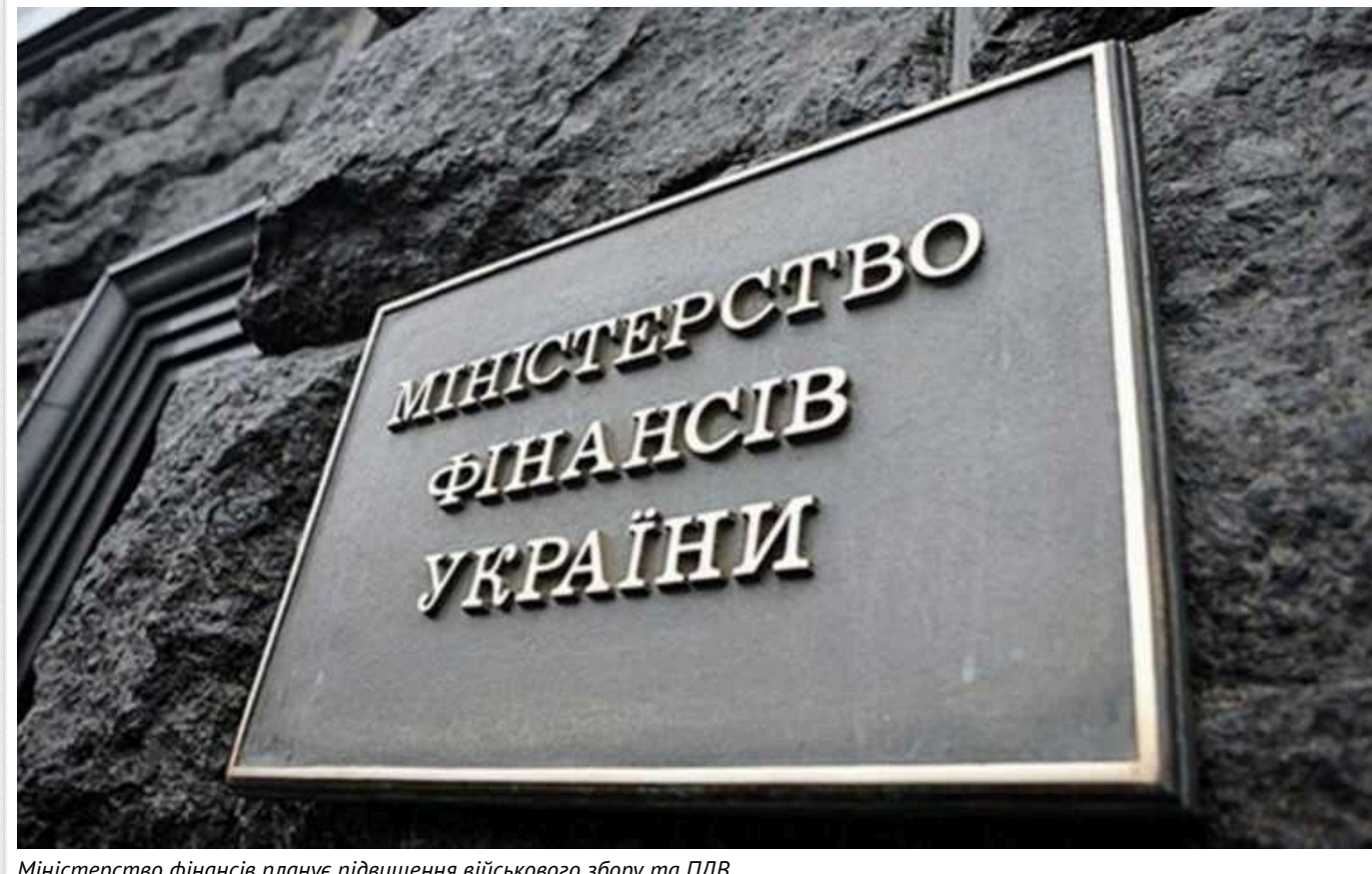
Міністерство фінансів планує підвищення військового збору та ПДВ

Про це пише Forbes Україна, з посиланням на джерела у Раді та Кабміні.