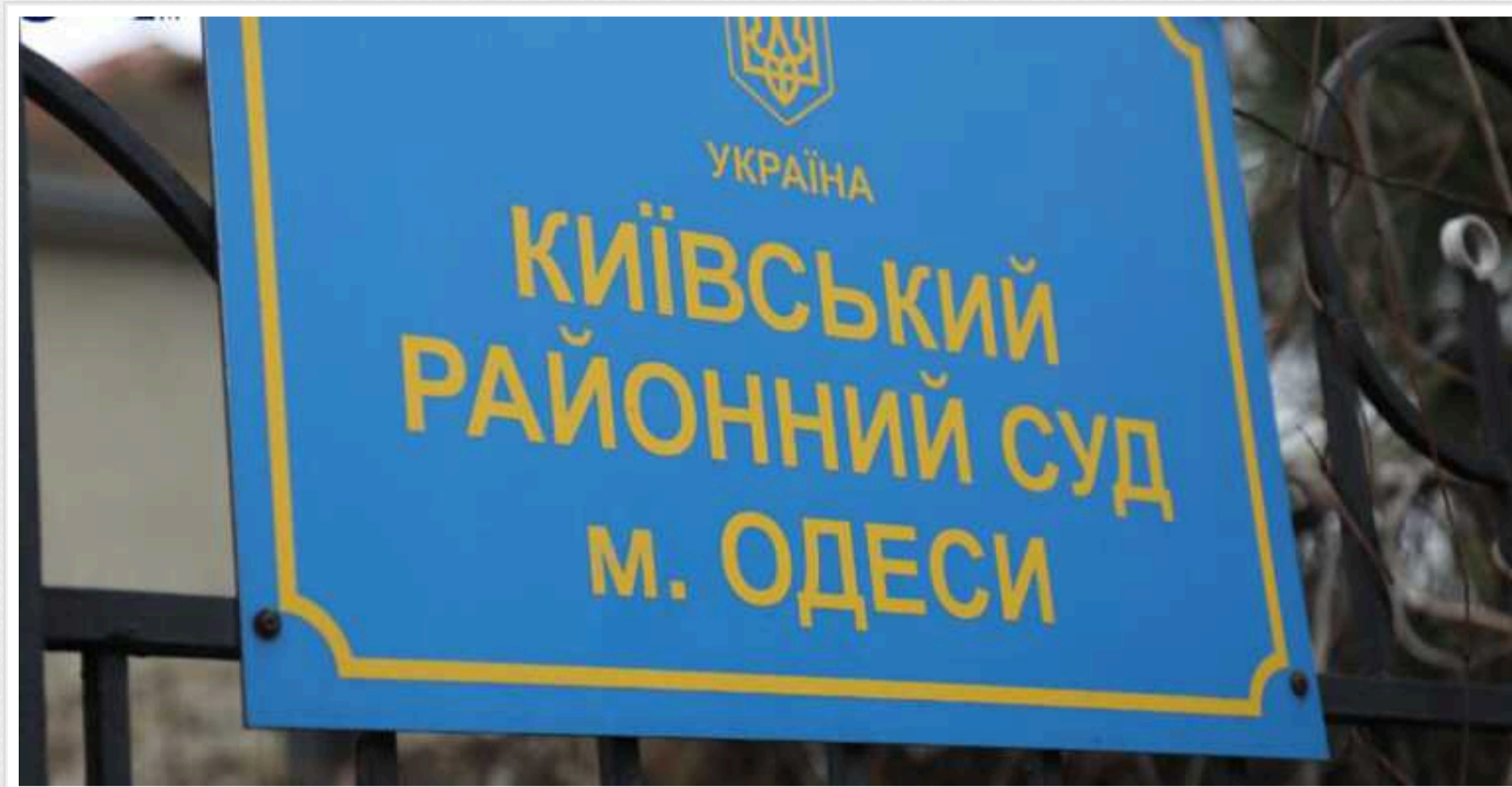
В Одесі умовно засудили бізнесмена та його сина за спробу завести раба

Київський районний суд міста Одеси визнав винними одеських підприємців у викраденні людини та вимаганні й засудив їх до п'яти та чотирьох років позбавлення волі, замінивши реальний термін на іспитовий.