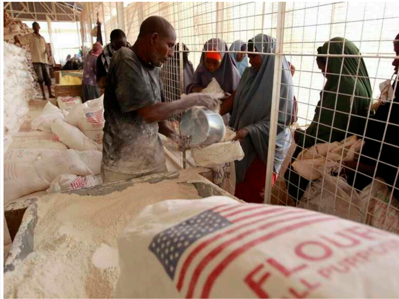
ООН потребує 400 мільйонів доларів для запобігання голоду на півдні Африки

Аби врятувати жителів південної Африки від масового голоду, ООН терміново потребує щонайменше 400 млн дол.