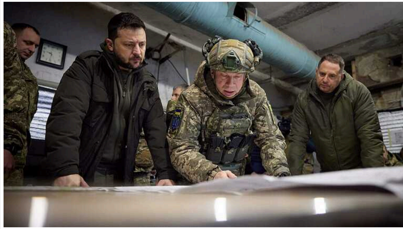
Зеленський і Сирський обговорили ситуацію на фронті: зараз максимум уваги прикордонню

Президент України Володимир Зеленський у середу, 22 травня, заслухав дві доповіді головнокомандувача ЗСУ Олександра Сирського щодо ситуації на фронті. Зараз максимум уваги приділяється усьому прикордонню.