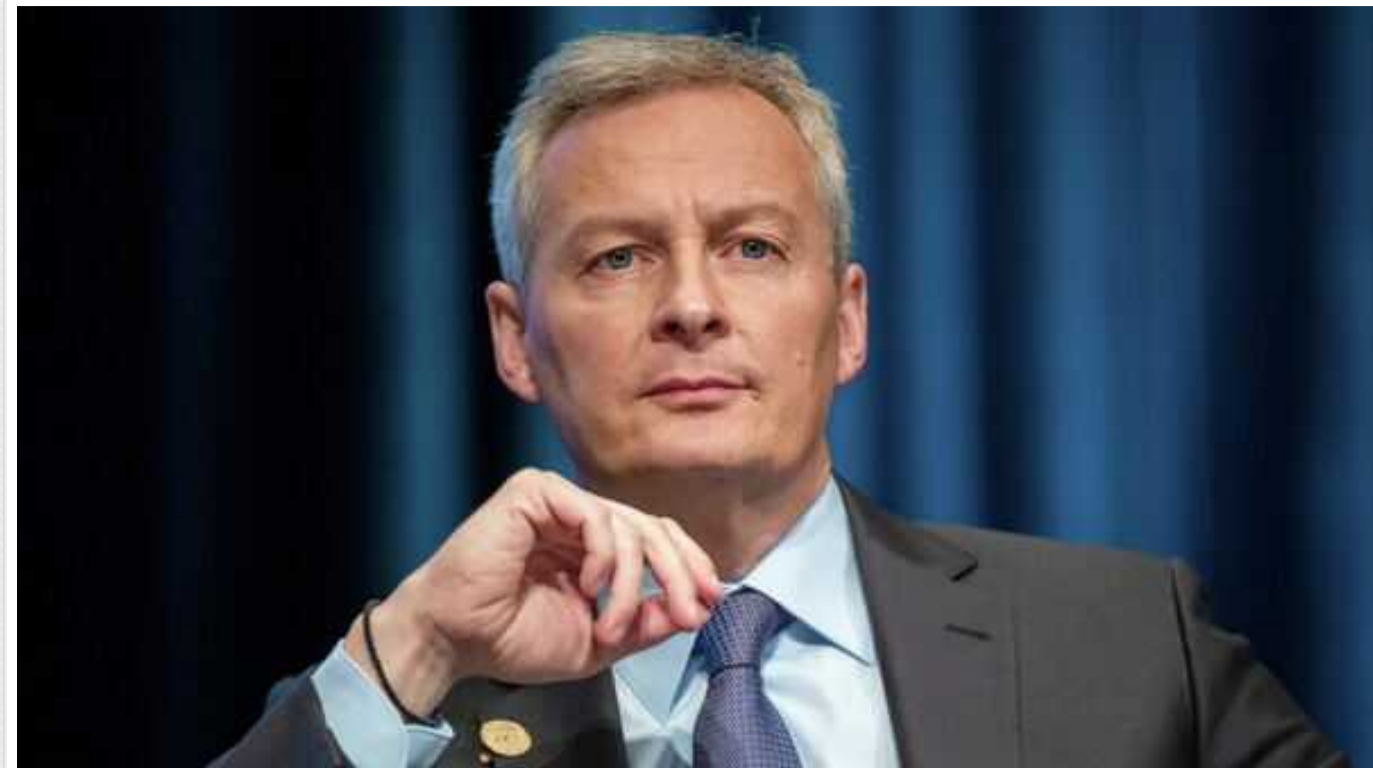
Франція підтримала ідею США про надання Україні 50 мільярдів доларів із російських активів

Уряд Франції підтримав пропозицію США, яка передбачає виділення Україні 50 млрд доларів, використовуючи заморожені російські активи.