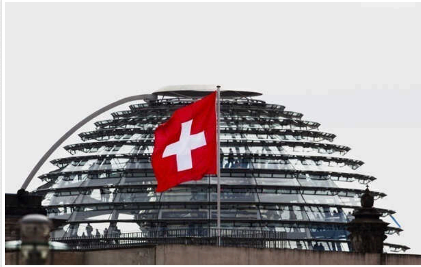
У Швейцарії на час проведення Саміту миру над Бюргенштоком закриють небо та розгорнуть війська

Влада Швейцарії посилить заходи безпеки на час проведення Глобального саміту миру, присвяченого питанням завершення війни в Україні.