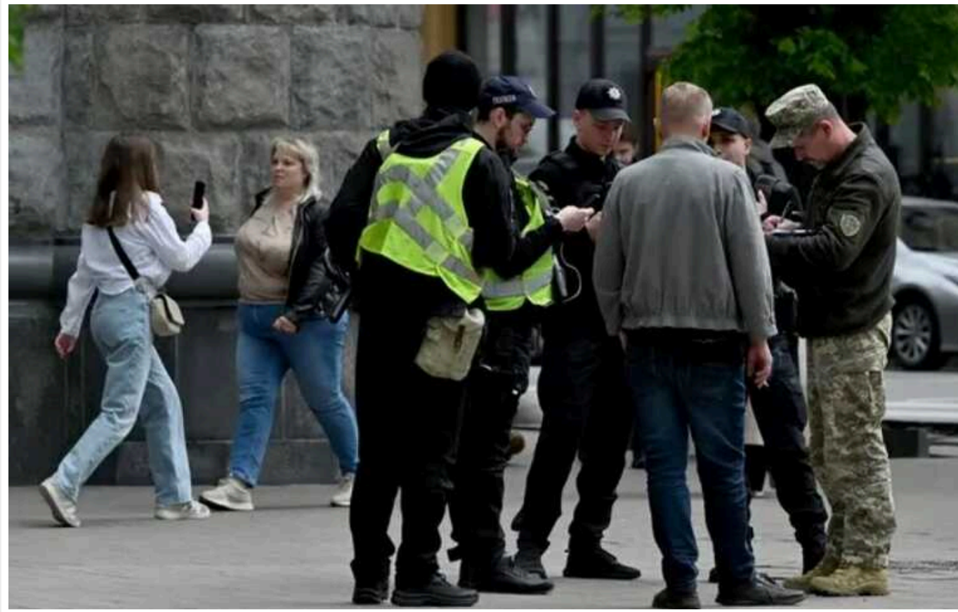
Оновивши дані через "Резерв+", чоловікі проходитимуть швидку перевірку даних у разі зупинки на вулиці

Оновивши дані через застосунок "Резерв+", чоловікі проходитимуть швидку перевірку даних у разі зупинки на вулиці замість примусової поїздки до ТЦК.