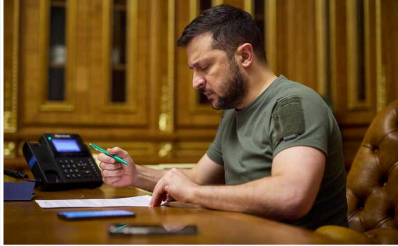
Зеленський підписав закон про працівників, які працюють із дому

Президент Володимир Зеленський підписав закон, який має врегулювати роботу домашніх працівників і знизити рівень незадекларованої праці.