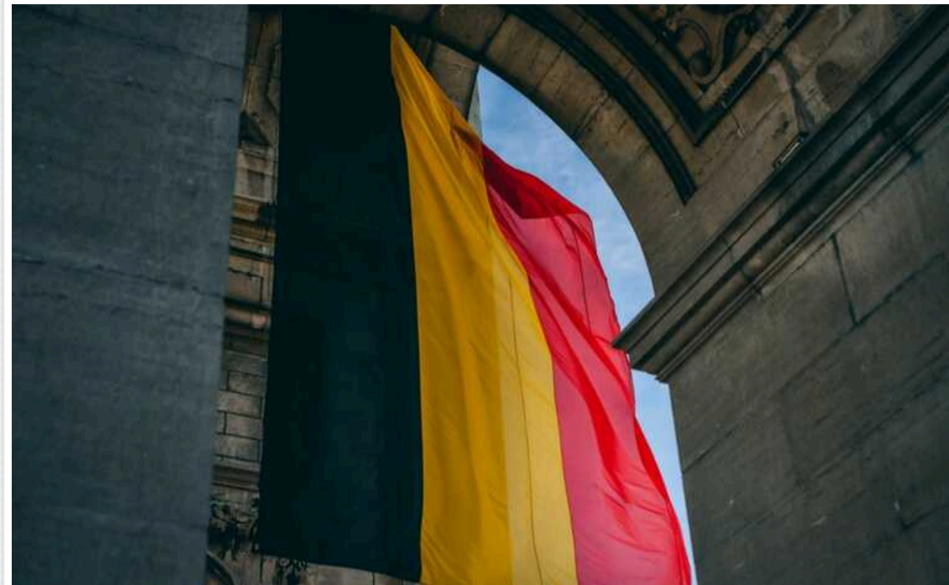
Бельгія відмовилася розблокувати активи клієнтів російського банку

Казначейство Бельгії відмовило ВТБ в отриманні ліцензії на розблокування клієнтських активів, заморожених у Euroclear.