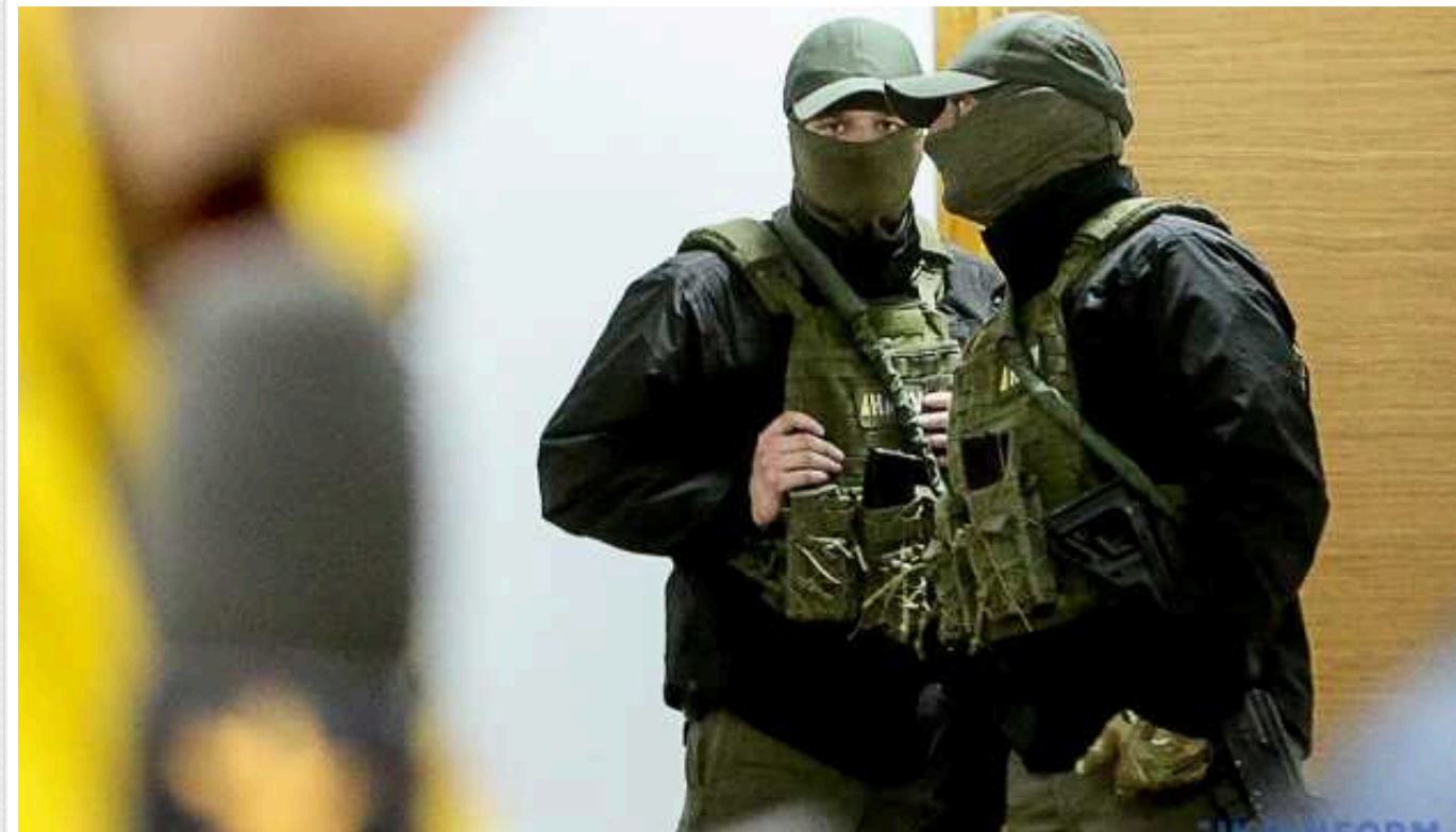
САП проводить обшуки у співробітника НАБУ щодо зливу даних за справою "Великого будівництва"

Спеціалізована антикорупційна прокуратура та представники поліції 22 травня проводять обшуки в представника Національного антикорупційного бюро в рамках розслідування про витік інформації в резонансній кримінальній справі щодо "Великого будівництва".