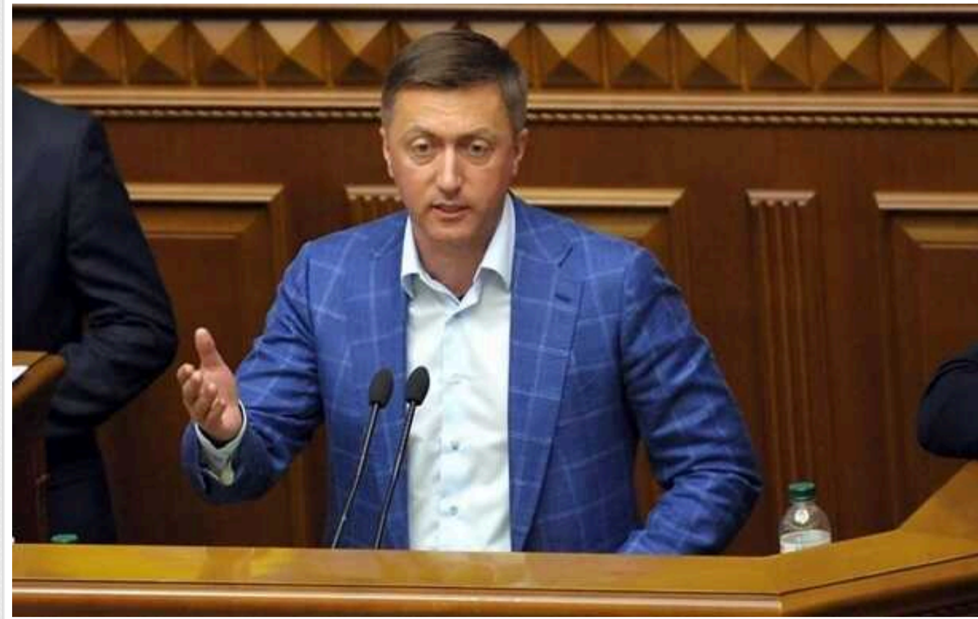
САП скерував справу нардепа Лабазюка до суду

Спеціалізована антикорупційна прокуратура (САП) скерувала до суду обвинувальний акт щодо народного депутата, обвинуваченого у спробі підкупу топчиновників у сфері відновлення. За даними журналіста Олега Новікова, йдеться про нардепа від групи "За майбутнє" Сергія Лабазюка, який дав хабар колишньому віцепрем'єр-міністру з відновлення Олександрю Кубракову та голові Держагентства відновлення та розвитку інфраструктури Мустафі Найему. Нардепу загрожує, серед іншого, позбавлення волі на строк від 5 до 10 років.