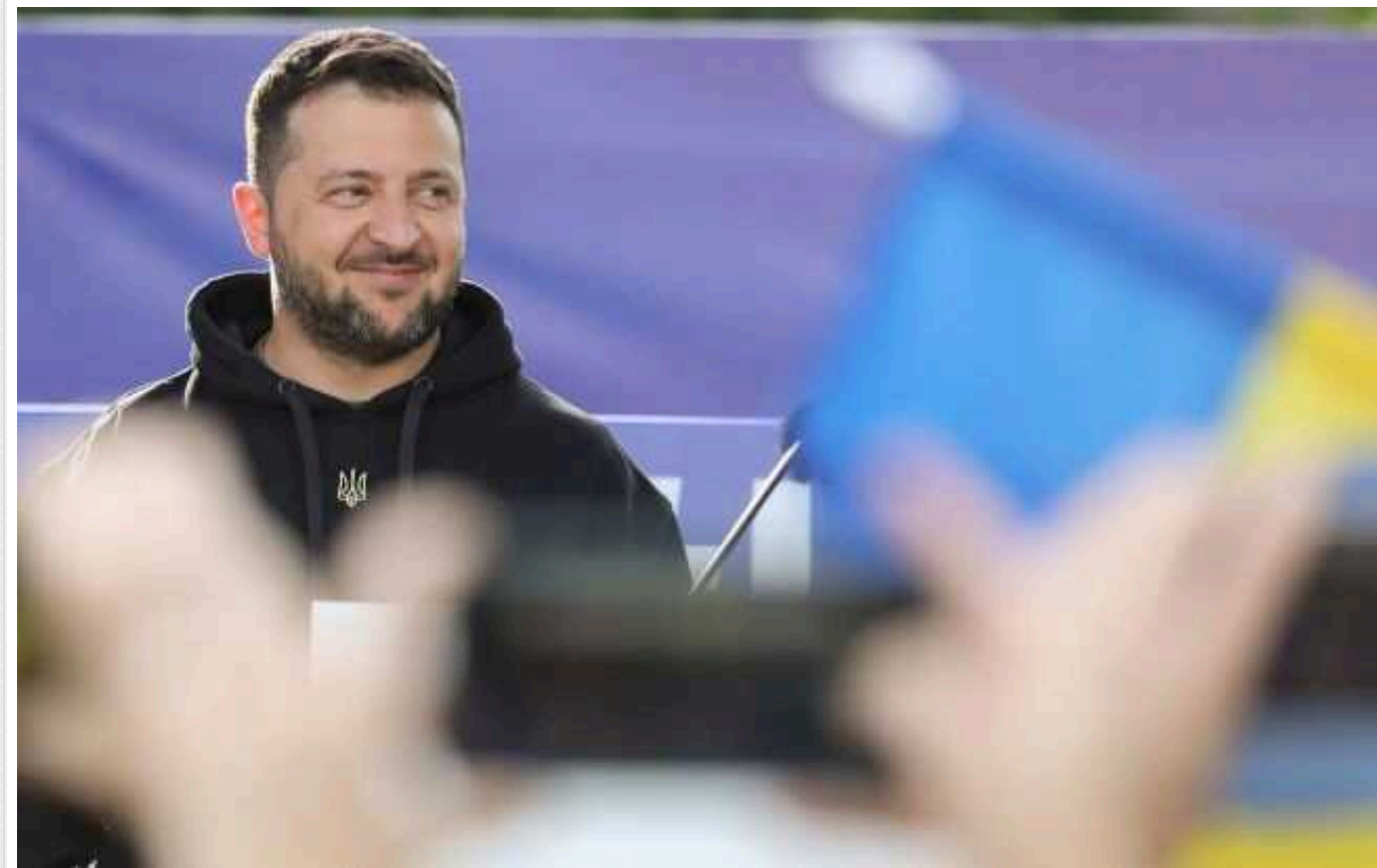
В ЄС заявили, що "не мають жодних сумнівів" щодо легітимності Зеленського

У Євросоюзі заявили про те, що не мають сумніву у легітимності президента України Володимира Зеленського через неможливість провести вибори під час воєнного стану. Конституція України чітко передбачає виконання чинним главою держави своїх обов'язків до вступу на посаду його наступника, обраного на виборах.