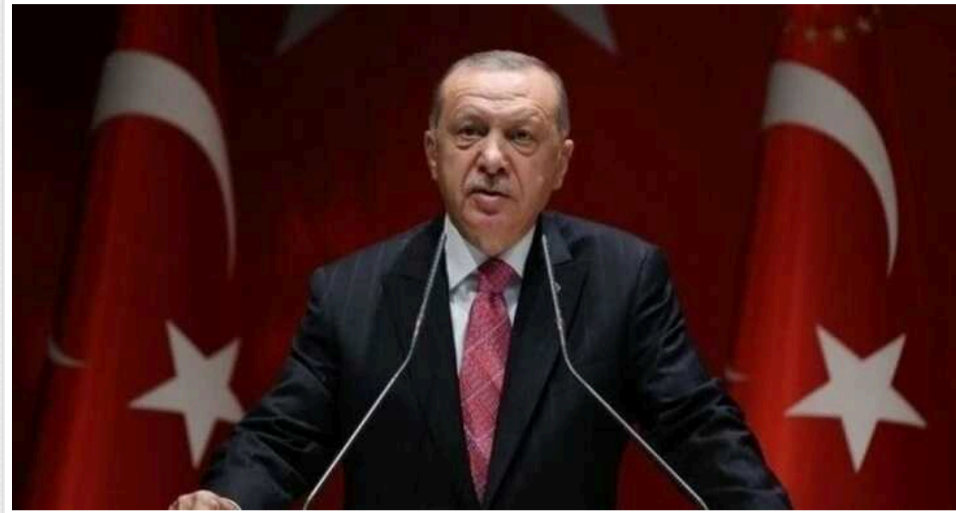
Ердоган різко висловився на адресу Євробачення-2024 та переможця конкурсу

Він назвав зниження народжуваності в Туреччині "екзистенційною загрозою" і "катастрофою" для країни.