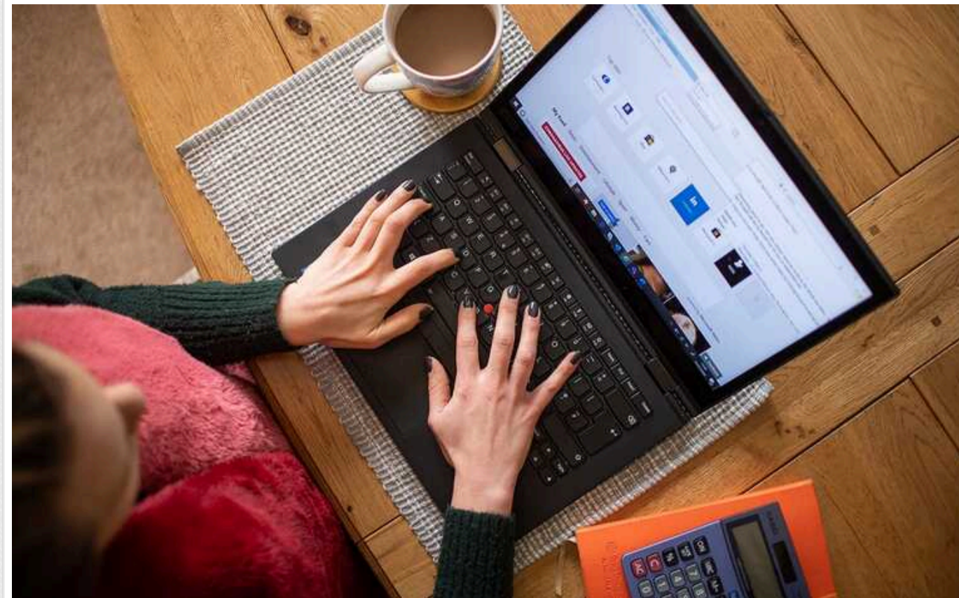
Співробітникам на "дистанційці" та у відпустці роботодавці надсилатимуть повістки, - постанова Кабміну

Роботодавці повинні будуть надсилати повістки поштою своїм співробітниками на "дистанційці" та у відпустці, а потім звітувати про це перед ТЦК.