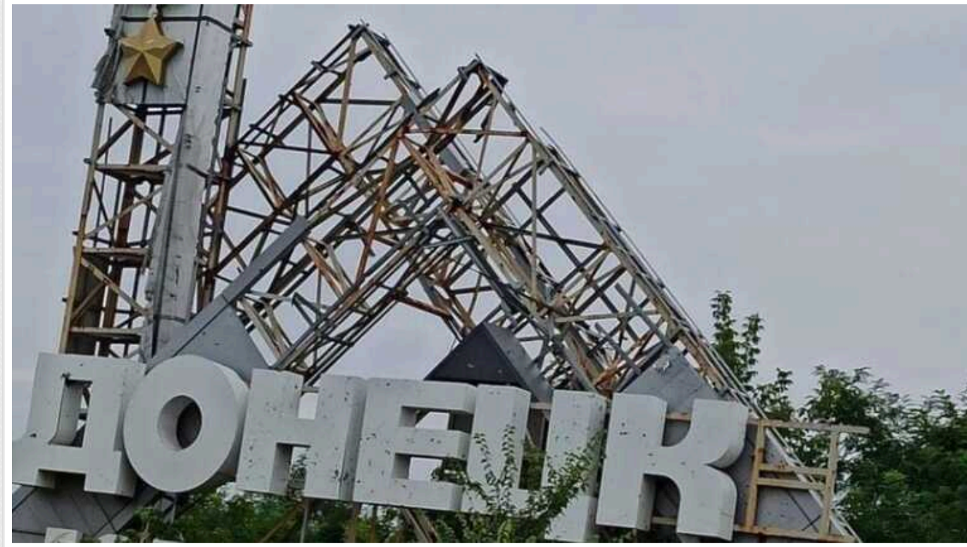
Блогер розповів про "покращення" життя на окупованій Донеччині