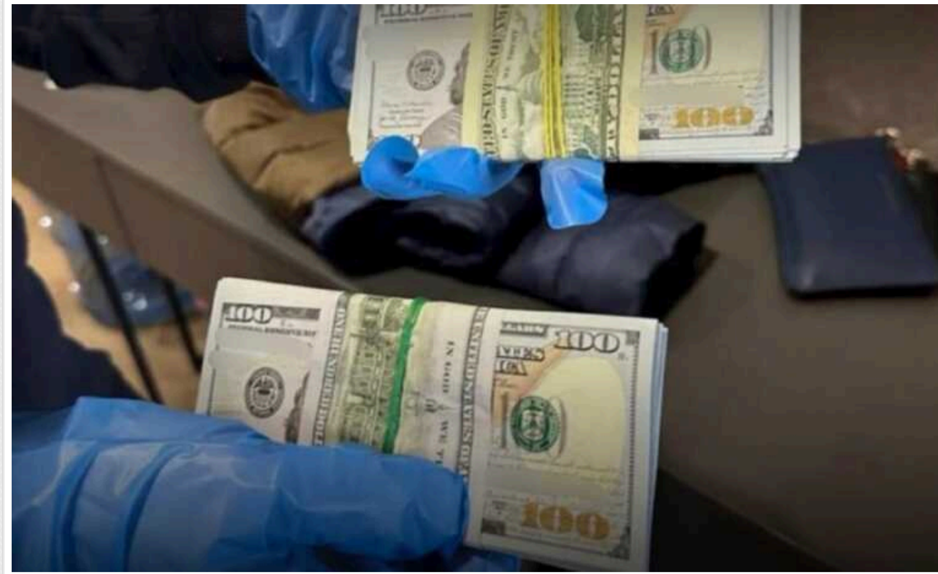
У справі щодо корупційних зловживань у податковій на Харківщині з'явилися нові підозрювані