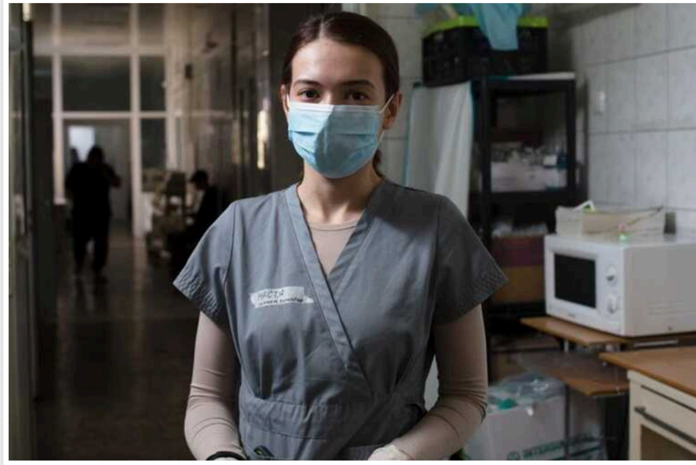
Усі жінки-медикині та жінки-фармацевтки мають стати на військовий облік, – ЗМІ

Відповідні зміни уряд вніс постановою від 16 травня .