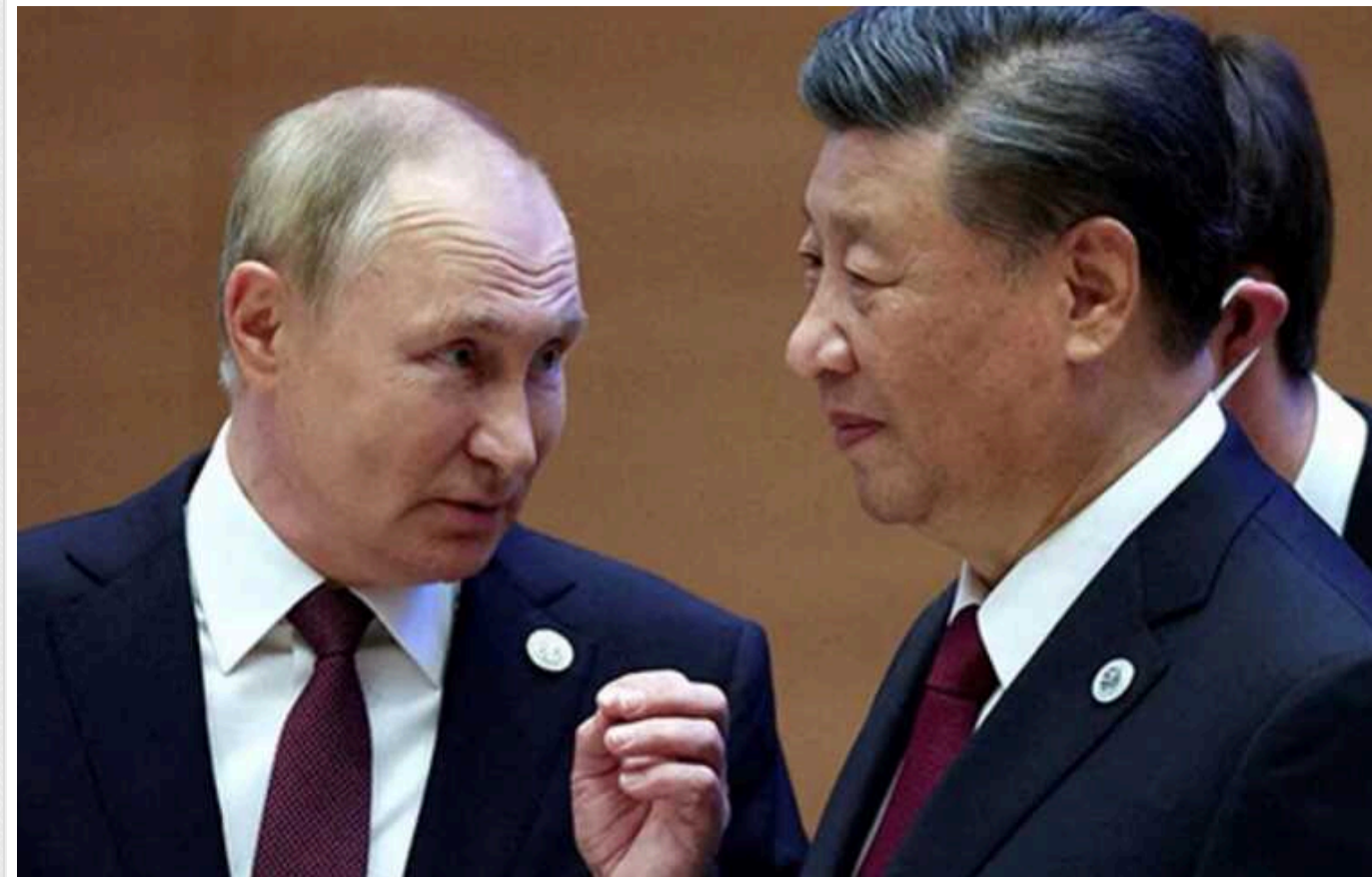
Bloomberg: Путін знову повернувся з КНР до Росії із «розбитим серцем»

Колумніст Девід Фіклінг вважає, що РФ проклатиме сотні тисяч тонн сталевих труб до Китаю, щоб дати Пекіну можливість вибору альтернативного джерела сирої нафти.