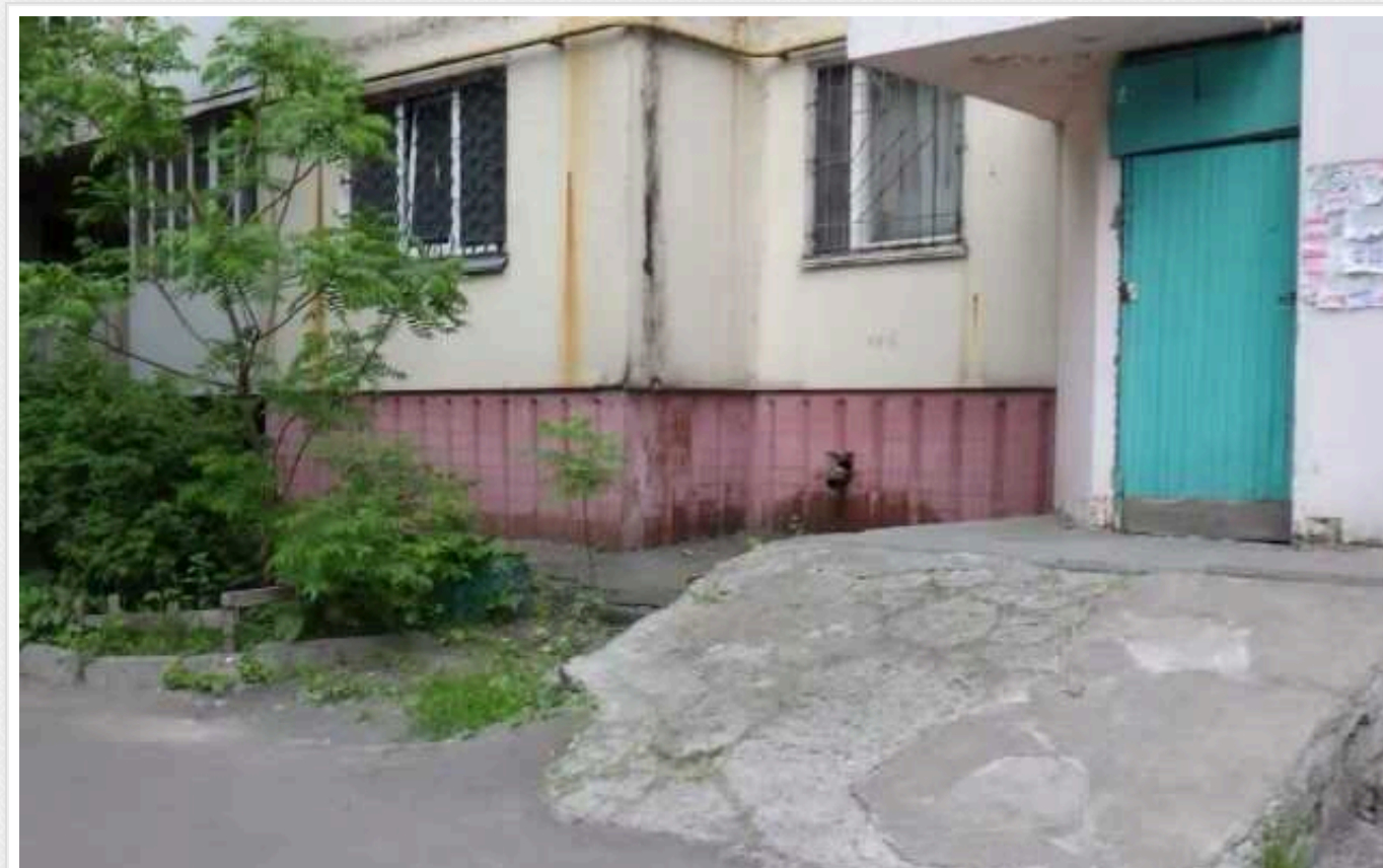
У столиці затримали рецидивіста, який виніс з квартири пенсіонера 6 400 доларів та 4 000 євро

Столиціні правоохоронці затримали чоловіка, який обікрав квартиру 89-річного пенсіонера. Зловмисник непомітно витягнув з кімнати літньої людини ключі від житла, а потім виніс звідти 6 400 доларів та 4 тисячі євро.