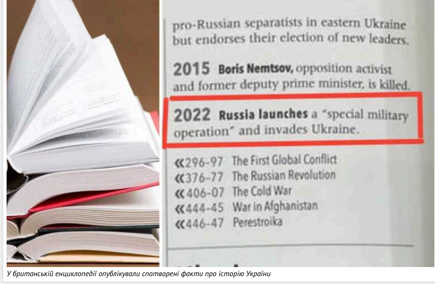
У британській енциклопедії опублікували спотворені факти про історію України