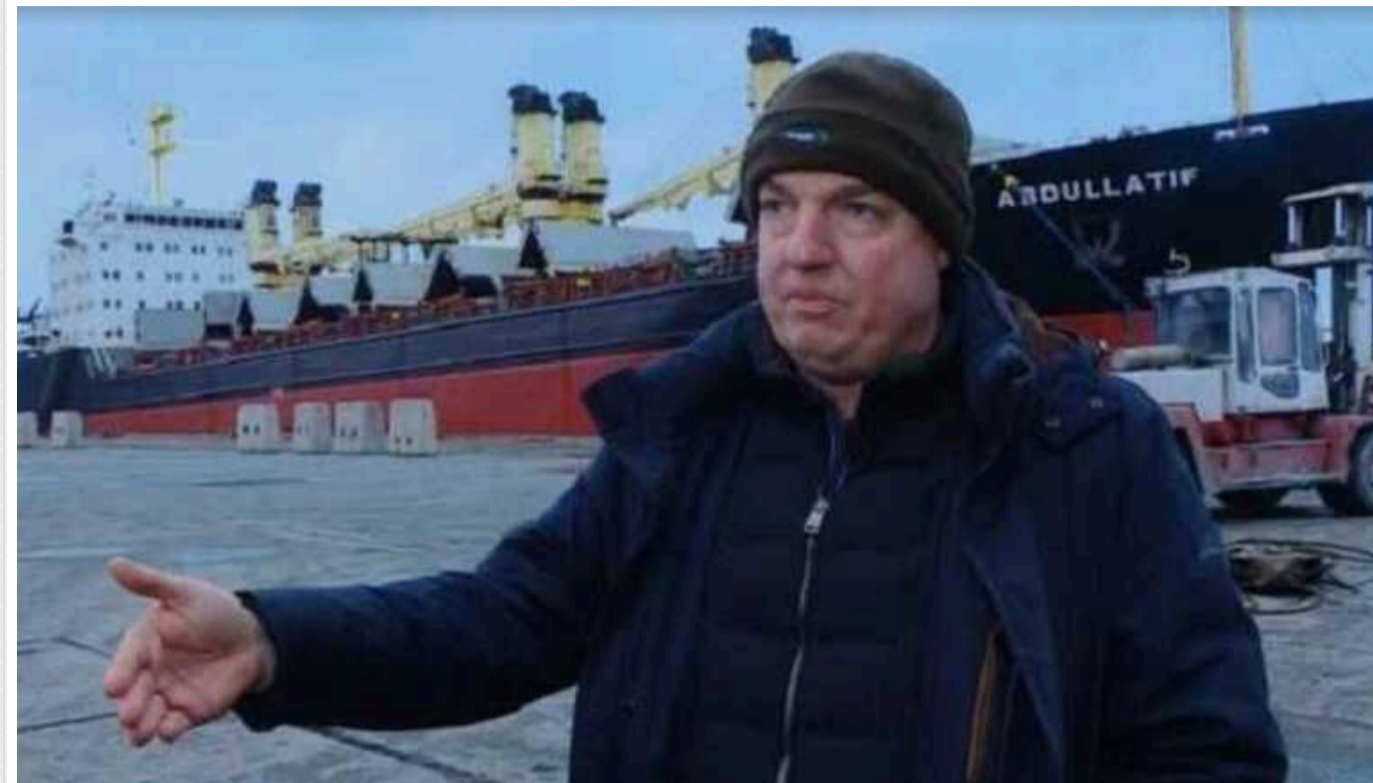
Морський порт «Чорноморськ» отримає нового керівника – ним стане «Валера 200$»

На Міністерство інфраструктури та його структурні підрозділи, найближчим часом, чекають кардинальні зміни. В тому числі і кадрові. Саме зараз, окремі діячі з «сумнівним минулим» вирішили здійснити свої давніші мрії про призначення на «хлібну» посаду.