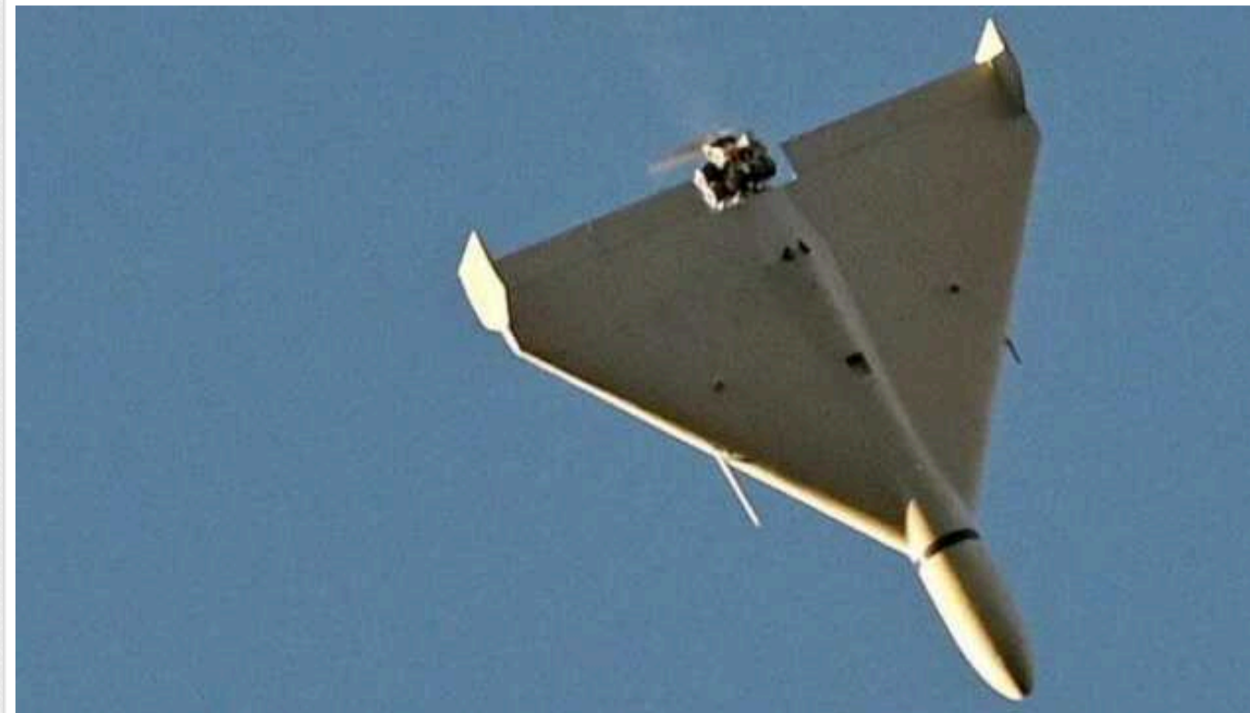
Нічна атака БПЛА на Харків: внаслідок атаки почалася пожежа, є постраждалі

У Харкові в результаті нічної ворожої атаки із застосуванням ударних безпілотників постраждали чотири людини, яким вже надана медична допомога. За попередніми даними, було влучання по одному з улюблених місць відпочинку у місті.