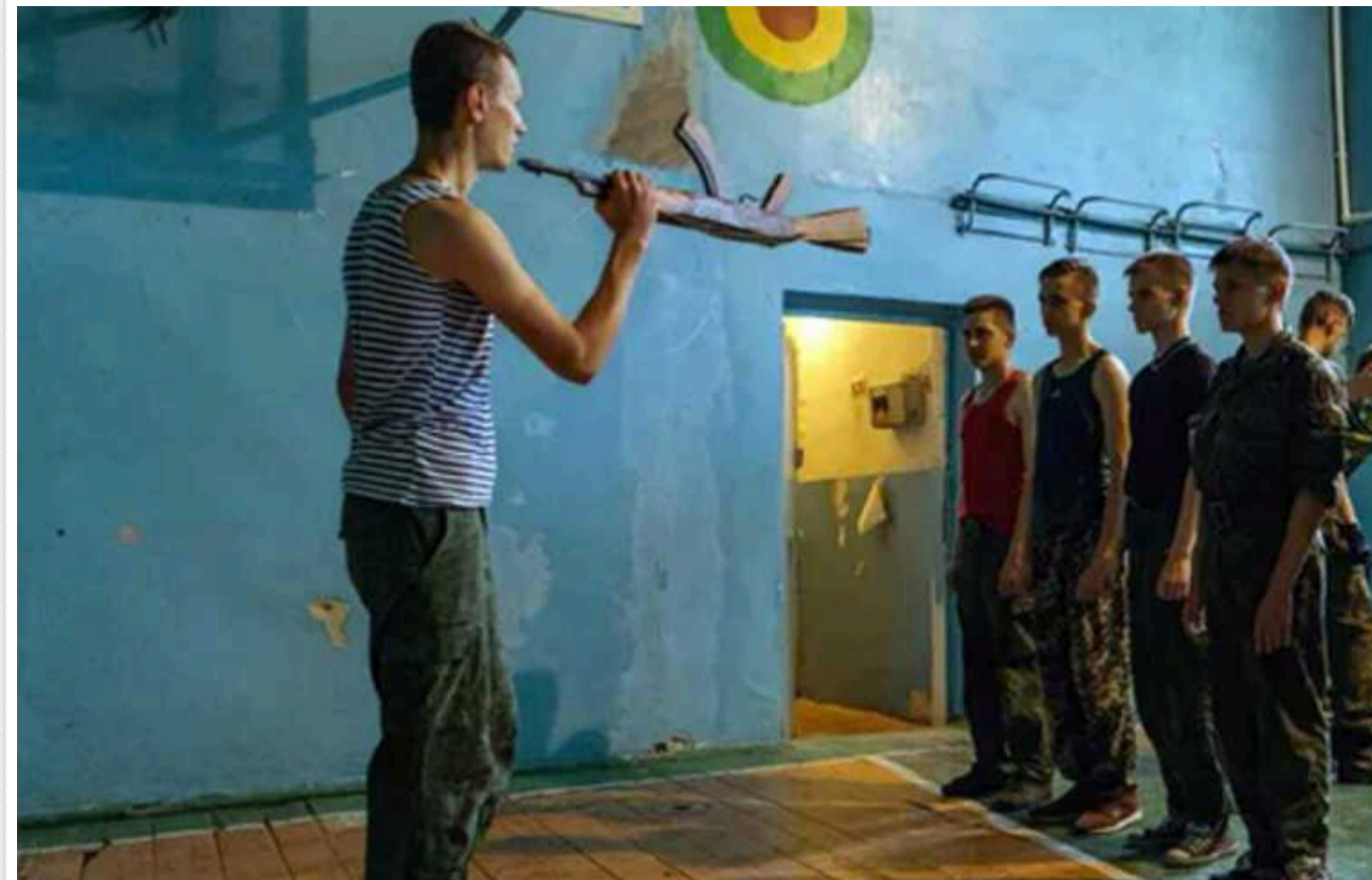
На окупованій Луганщині росіяни "промивають мізки" школярам

Російська окупаційна так звана влада продовжує "перекроювати" на кремлівський лад свідомість дітей, які проживають на захоплених територіях. Під виглядом "сімейних цінностей" школярам змалку намагаються вбити в мізки ненависть до України та розуміння, нібито їхній обов'язок – захищати Росію.