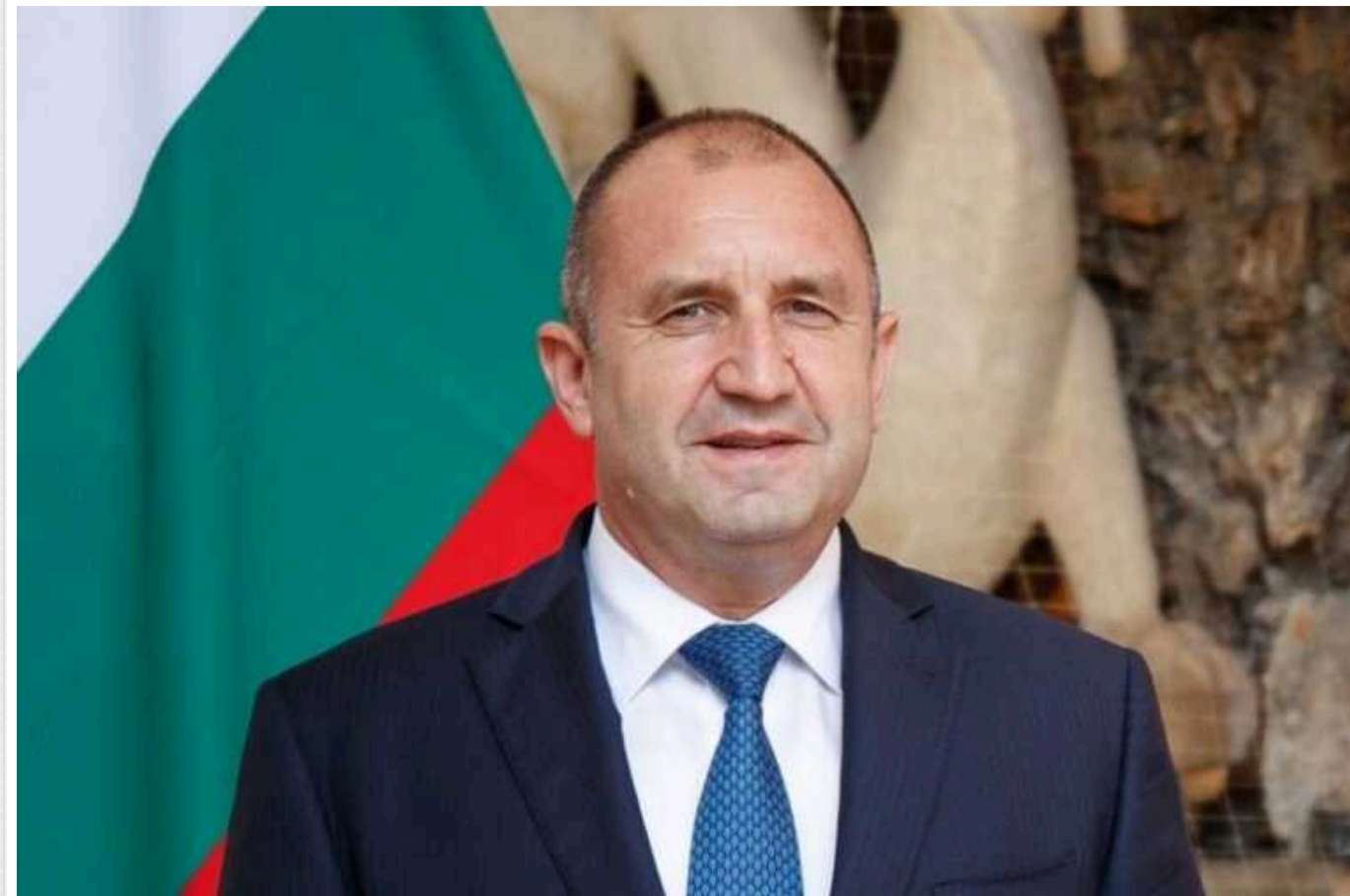
Перемога України над Росією «неможлива», - президент Болгарії Румен Радев